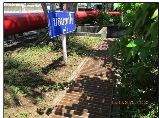
บ่อแยกไขมันจุดที่ 4