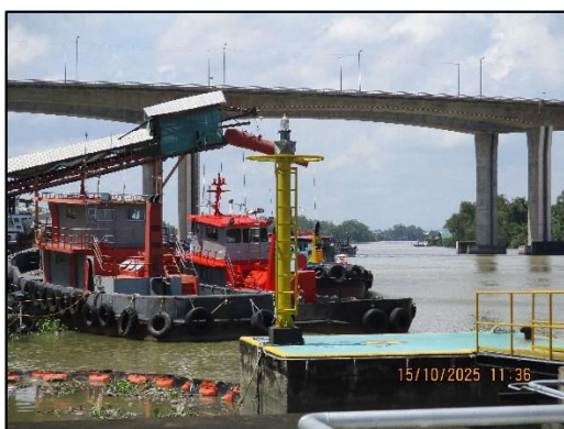
ภาพถ่ายที่ 2.2-12 สัญญาณไฟกระพริบบริเวณ ท่าเทียบเรือก๊าซ