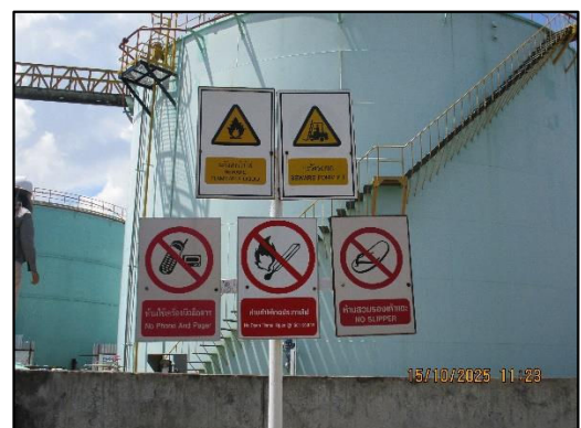
ภาพถ่ายที่ 2.2-19 ป้ายเตือนสวมใส่อุปกรณ์ป้องกัน อันตรายส่วนบุคคล บริเวณคลังน้ำมัน