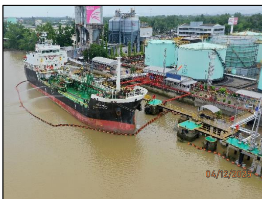
ภาพถ่ายที่ 2.2-5 การควบคุมการรั่วไหลของน้ำมัน ระหว่างการขนถ่าย