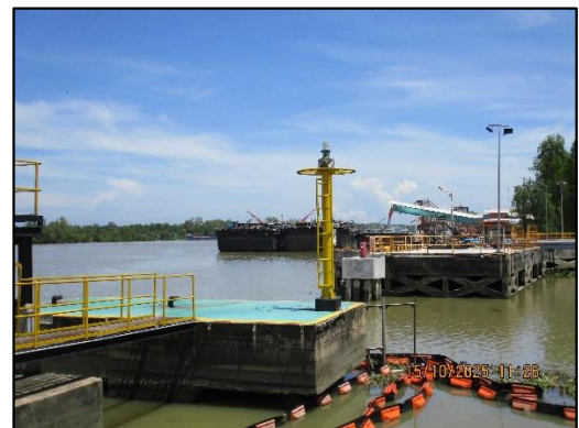
ภาพถ่ายที่ 2.2-11 สัญญาณไฟกระพริบบริเวณ ท่าเทียบเรือน้ำมัน