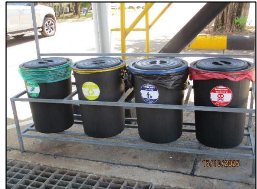
ภาพถ่ายที่ 2.2-15 ภาชนะบรรจุขยะมูลฝอยแยกประเภท