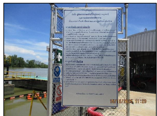
ภาพถ่ายที่ 2.2-13 ประกาศกฎความปลอดภัยทั่วไป บริเวณท่าเทียบเรือ