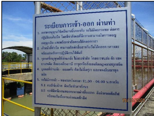
ภาพถ่ายที่ 2.2-14 ประกาศระเบียบการเข้า-ออก ผ่านท่าบริเวณท่าเทียบเรือ