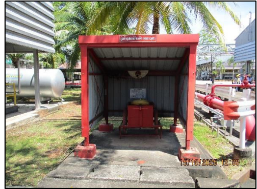
ภาพถ่ายที่ 2.2-29 จุดเก็บสายฉีดน้ำดับเพลิง