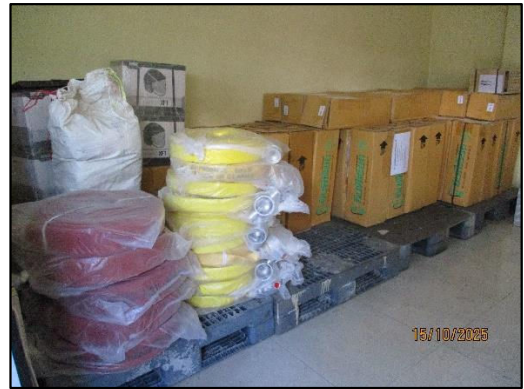
ภาพถ่ายที่ 2.2-26 ชุดผจญเพลิงและกู้ภัย