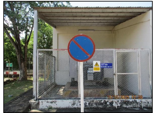
ภาพถ่ายที่ 2.2-9 ป้ายเตือนและบังคับจราจรภายในพื้นที่โครงการ