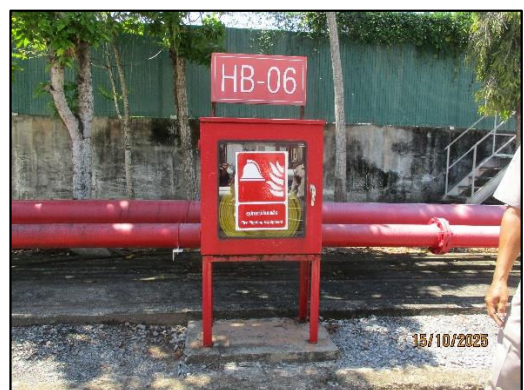
ภาพถ่ายที่ 2.2-25 ระบบท่อน้ำดับเพลิง และสายฉีดน้ำดับเพลิง