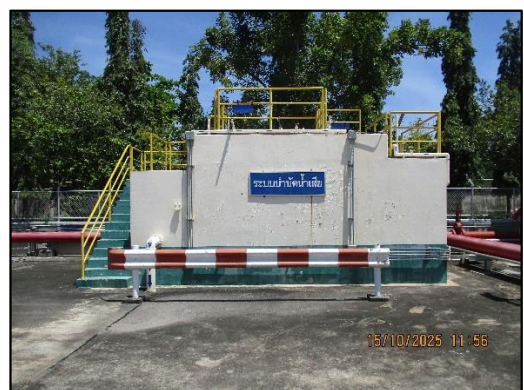
ภาพถ่ายที่ 2.2-6 ระบบบำบัดน้ำเสีย