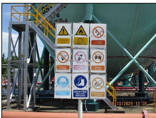
ภาพถ่ายที่ 2.2-18 ป้ายเตือนสวมใส่อุปกรณ์ป้องกัน อันตรายส่วนบุคคล บริเวณคลังก๊าซธรรมชาติ