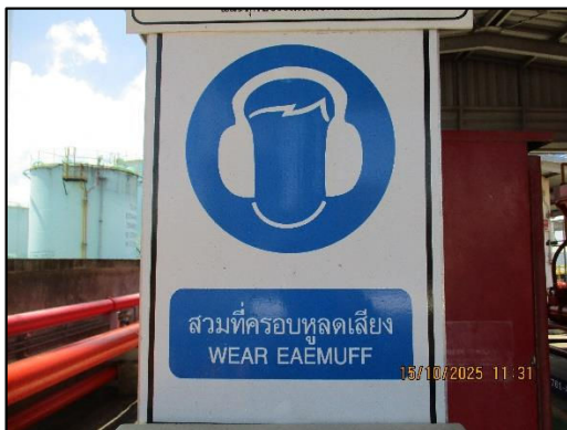
ภาพถ่ายที่ 2.2-3 ป้ายเตือนสวมใส่อุปกรณ์ป้องกัน อันตรายจากเสียงดัง