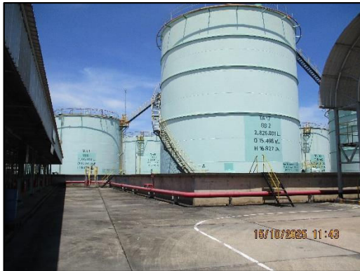
ภาพถ่ายที่ 2.2-20 ระบบฉีดน้ำดับเพลิง บริเวณถังเก็บน้ำมัน