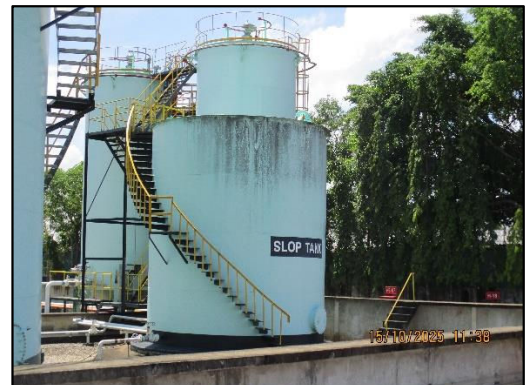
ภาพถ่ายที่ 2.2-17 Slop Tank