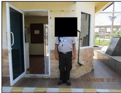
ภาพถ่ายที่ 2.2-30 เจ้าหน้าที่ดูแลและรักษาความปลอดภัยประจำโครงการ