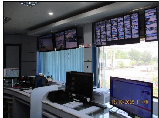
ภาพถ่ายที่ 2.2-2 ศูนย์ควบคุมการปฏิบัติการ