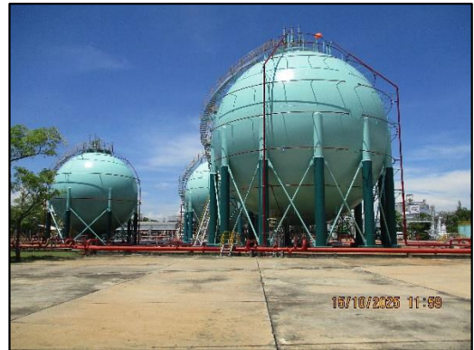
ภาพถ่ายที่ 2.2-21 ระบบฉีดน้ำดับเพลิง บริเวณถังเก็บก๊าซปิโตรเลียมเหลว