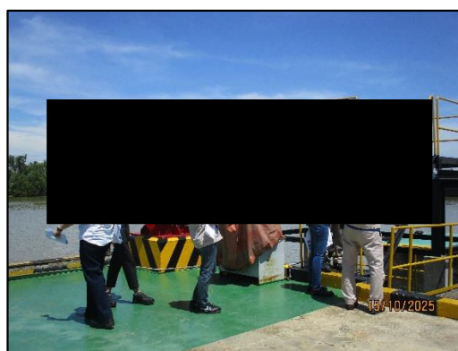
ภาพถ่ายที่ 2.2-1 การติดตามตรวจสอบการปฏิบัติตามมาตรการป้องกันและแก้ไขผลกระทบสิ่งแวดล้อม ระหว่างเดือนกรกฎาคม-ธันวาคม พ.ศ. 2568