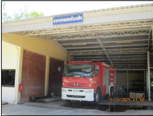
ภาพถ่ายที่ 2.2-28 รถดับเพลิงประจำโครงการ