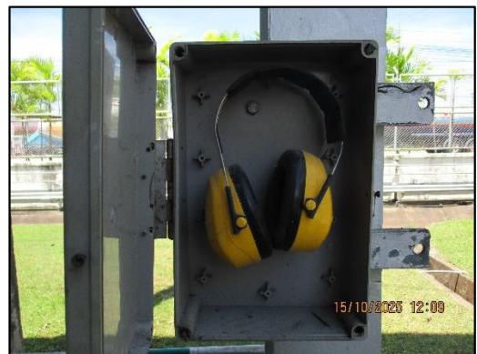
ภาพถ่ายที่ 2.2-4 อุปกรณ์ป้องกันอันตรายจากเสียง สำหรับผู้ปฏิบัติงานในพื้นที่เสียงดัง