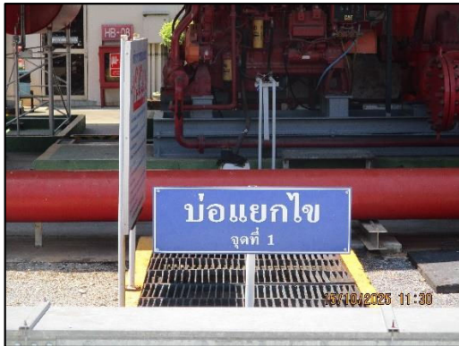
บ่อแยกไขมันจุดที่ 1