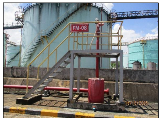
ภาพถ่ายที่ 2.2-27 ระบบจ่ายน้ำดับเพลิง