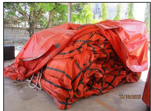
ภาพถ่ายที่ 2.2-8 ตัวอย่างอุปกรณ์กำจัดคราบน้ำมัน