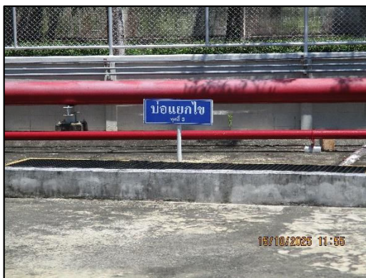
บ่อแยกไขมันจุดที่ 3