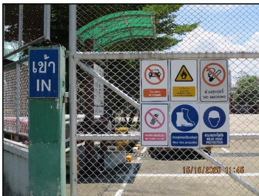
ภาพถ่ายที่ 2.2-10 ป้ายเตือนระวางรถเข้า-ออกจาก โครงการบริเวณทางเข้าโครงการ