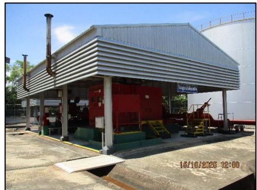
ภาพถ่ายที่ 2.2-23 เครื่องสูบน้ำดับเพลิง