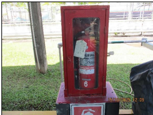
ภาพถ่ายที่ 2.2-22 ถังดับเพลิง