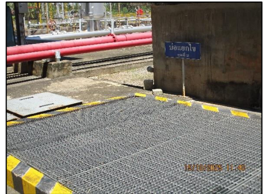
บ่อแยกไขมันจุดที่ 2