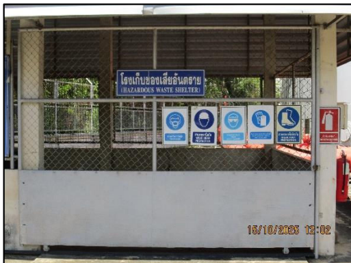
ภาพถ่ายที่ 2.2-16 โรงเก็บของเสียอันตราย